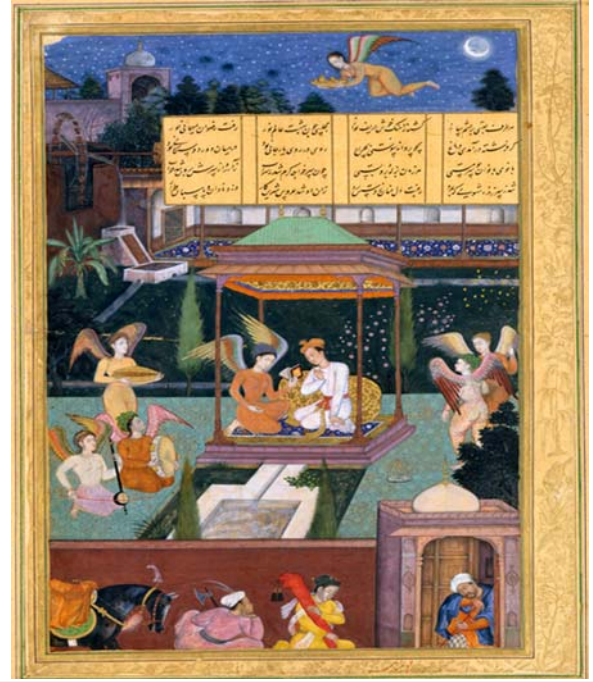
لوحة رقم (٧)

صورة من مخطوط (خمسة) لأمير خسرو الدهلوي، (الهند - لاهور - سنة ١٥٩٧م)، توضح الحورية وهي تستقبل شاب غريب بالحديقة محفوظة في متحف المتروبوليتان للفن بنيويورك تحت رقم (١٣-٢٢٨-٣٣)