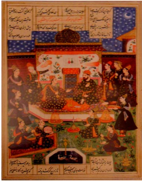
لوحة رقم (٥)

صورة من مخطوط خمسة لنظامي توضح بهرام جور والأمراء الهنود، (الهند - أحمد آباد، سنة ١٦١٨ م) Losty, Jeremiah P., The Art of the Book in India (1982), pl. 45