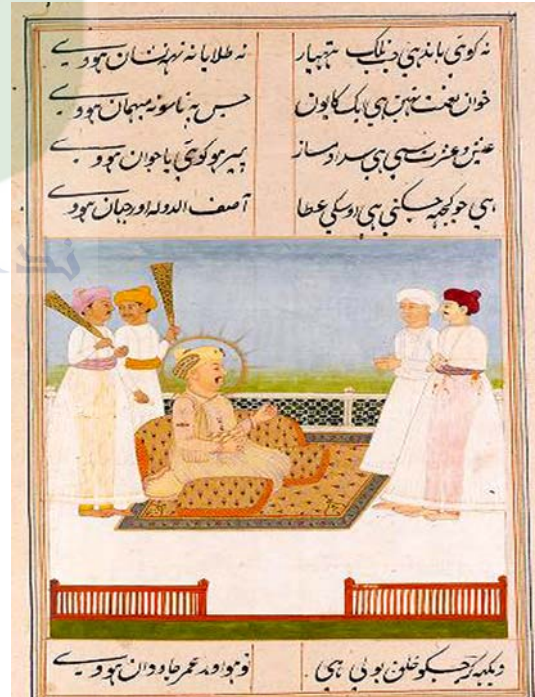
لوحة رقم (٨)

صورة من مخطوط (خمسة) لأمير خسرو الدهلوي، (الهند - لاهور - سنة ١٥٩٧م)، توضح الحورية وهي تستقبل شاب غريب بالحديقة محفوظة في متحف المتروبوليتان للفن بنيويورك تحت رقم (١٣-٢٢٨-٣٣)