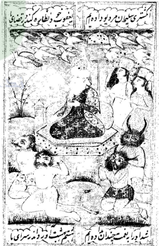
لوحة رقم (٤)

صورة من مخطوط العروش السبعة لجامي (شمال الهند، سنة ١٧٥٠ م)، توضح منظر وصول يوسف إلى زليخة محفوظة في المكتبة الأهلية بباريس تحت رقم (od 44 fol., 32. Don du colonel Gentil, 1785. Cat. RH n. 144)